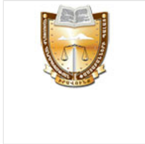
18.01.2018 ՀԱՅՏԱՐԱՐՈՒԹՅԱՆԸ ՄԻԱՑԵԼ Է 907 ՓԱՍՏԱԲԱՆ