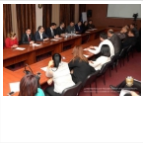
17.01.2018 Numerous advocates made a demand to the National Assembly and The Government