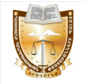
17.09.2013 ՍԵՊՏԵՄԲԵՐ ԱՄՍՎԱ ՎԵՐԱՊԱՏՐԱՍՏՄԱՆ ԴԱՍԸՆԹԱՑՆԵՐ