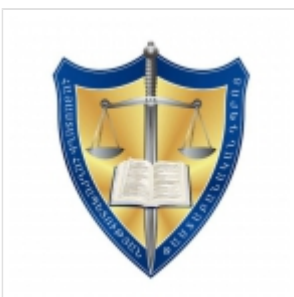
13.01.2014 2014 ԹՎԱԿԱՆԻ ՀՈՒՆՎԱՐ ԱՄՍՎԱ