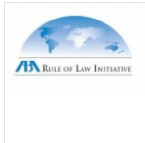
03.12.2013 ՔՆՆԱՐԿՈՒՄ՝ «ՑՈՒՑՄՈՒՆՔՆԵՐԻ ԴԱՏԱԿԱՆ ԴԵՊՈՆԱՑՈՒՄԸ» ԹԵՄԱՅՈՎ