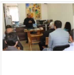
09.10.2013 ԱՎԱՐՏՎԵՑ «ՍՏՐԱՏԵԳԻԱՅԻ ԱՐՎԵՍԸ» ԹԵՄԱՅՈՎ ՎԵՐԱՊԱՏՐԱՍՄԱՆ ԴԱՍԸՆԹԱՑԸ