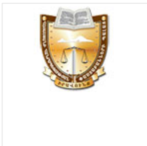
17.09.2013 ՍԵՊՏԵՄԲԵՐ ԱՄՍՎԱ ՎԵՐԱՊԱՏՐԱՍՄԱՆ ԴԱՍԸՆԹԱՑՆԵՐ