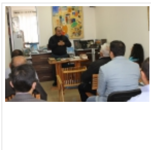
09.10.2013 ԱՎԱՐՏՎԵՑ «ՍՏՐԱՏԵԳԻԱՅԻ ԱՐՎԵՍԸ» ԹԵՄԱՅՈՎ ՎԵՐԱՊԵՏՈՒԹՅԱՆ ԴԱՍԸՆԹԱՑԸ