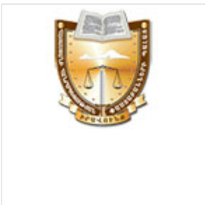
17.09.2013 ՍԵՊՏԵՄԲԵՐ ԱՄՍՎԱ ՎԵՐԱՊԵՏՈՒԹՅԱՆ ԴԱՍԸՆԹԱՑՆԵՐ