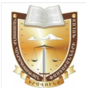
29.06.2016 ՄԱՐԶԱՅԻՆ ՀԱՄԱԿԱՐԳՈՂՆԵՐԻ ԵՎ