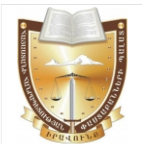
30.08.2018ԱՐՄԱՎԻՐԻ ՄԱՐԶԻ ՄԱՐԶԱՅԻՆ