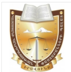
07.09.2018ԱՐՄԱՎԻՐԻ ՄԱՐԶՈՒՄ ՄԱՐԶԱՅԻՆ