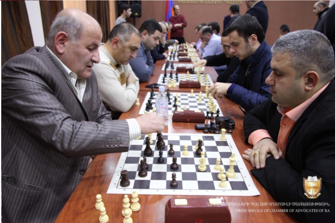
ՀՀ ՓՈՒՐԱՐԱՆԵՐԻ ՊԱՍՏԻ ՄԱՍԻՆԻ ՕՍՈՒՅՈՒԹՅՈՒՆ PRESS SERVICE OF CHAMBER OF ADVOCATES OF RA