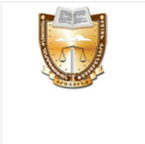
17.09.2013 ՍԵՊՏԵՄԲԵՐ ԱՄՍՎԱ ՎԵՐԱՊԱՏՐԱՍՄԱՆ ԴԱՍԸՆԹԱՑՆԵՐ