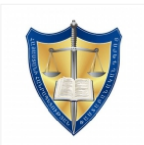
30.09.2013 ԴԱՍԸՆԹԱՑՆԵՐԻ ՓՈՓՈԽՈՒԹՅՈՒՆ