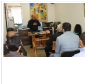
09.10.2013 ԱՎԱՐՏՎԵՑ «ՍՏՐԱՏԵԳԻԱՅԻ ԱՐՎԵՍԸ» ԹԵՄԱՅՈՎ ՎԵՐԱՊԱՏՐԱՍՄԱՆ ԴԱՍԸՆԹԱՑԸ