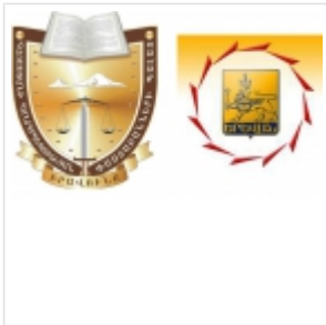
17.12.2015 ԽՍՏՈՐԵՆ ՀԱՆՁՆԱՐԱՐՎԵԼ Է ԵՐԵՎԱՆԻ ՎԱՐՉԱԿԱՆ ՇՐՋԱՆՆԵՐԻ ԽՆԱՄԱԿԱԼՈՒԹՅԱՆ ԵՎ ՀՈԳԱԲԱՐՁՈՒԹՅԱՆ ՀԱՆՁՆԱԺՈՂՈՎՆԵՐԻ ՆԱԽԱԳԱՀՆԵՐԻՆ ՉԽՈՉԸՆԴՈՏԵԼ ՓԱՍՏԱԲԱՆՆԵՐԻ ԳՈՐԾՈՒՆԵՈՒԹՅԱՆԸ