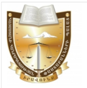
29.10.2013 ԱԿՈՒՄԲԻ ՆԻՍԻ ՀՐԱՎԵՐ