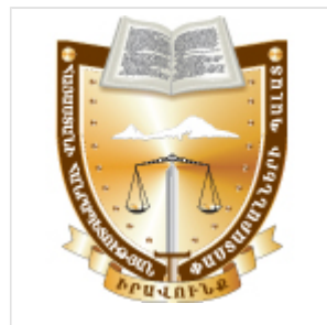
07.07.2017 ՀՀ ՓԱՍՏԱԲԱՆՆԵՐԻ ՊԱԼԱՏԻ ԱԿՈՒՄԲԻ ՆԻՍ՝ ԴԱՏԱԿԱՆ ԿԱՐԳԱԴՐԻՉՆԵՐԻ ԿՈՂՄԻՑ ՓԱՍՏԱԲԱՆՆԵՐԻՆ ԶՆՆԵԼՈՒ ԵՎ ՓԱՍՏԱԲԱՆՆԵՐԻ ԿՈՂՄԻՑ ԴԱՏԱԿԱՆ ՆԻՍՏԵՐԻ ԴԱՀԼԻՃԸ ԼՔԵԼՈՒ ԻՐԱՎԱԶԱՓՈՒԹՅԱՆ ՀԱՐՑԵՐԻ ՎԵՐԱԲԵՐՅԱԼ