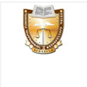
17.09.2013 ՍԵՊՏԵՄԲԵՐ ԱՄՍՎԱ ՎԵՐԱՊԱՏՐԱՍՏԱՆ ԴԱՍԸՆԹԱՑՆԵՐ