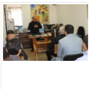
09.10.2013 ԱՎԱՐՏՎԵՑ «ՍՏՐԱՏԵԳԻԱՅԻ ԱՐՎԵՍԸ» ԹԵՄԱՅՈՎ ՎԵՐԱՊԱՏՐԱՍՏԱՆ ԴԱՍԸՆԹԱՑԸ