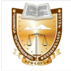
29.10.2014 ՀԱՅՏԱՐԱՐՈՒԹՅՈՒՆ «ԺԱՄԱՆԱԿԱՎՈՐ ԱՆԱՇԽԱՏՈՒՆԱԿՈՒԹՅԱՆ ՆՊԱՍՏՆԵՐԻ ՄԱՍԻՆ» ՀՀ ՕՐԵՆՔՈՒՄ ԼՐԱՑՈՒՄՆԵՐ ԵՎ ՓՈՓՈԽՈՒԹՅՈՒՆՆԵՐ ԿԱՏԱՐԵԼՈՒ ՄԱՍԻՆ» ՀՀ ՕՐԵՆՔԻ ՆԱԽԱԳԾԻ ՎԵՐԱԲԵՐՅԱԼ