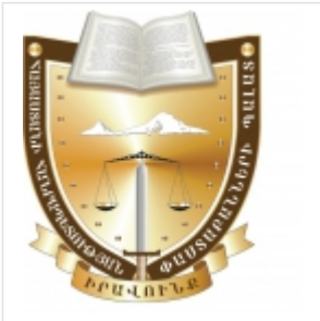
19.11.2013 ՇՆՈՐՀԱՎԱԼԱԿԱՆ ՆԱՄԱԿ ՓԱՍՏԱԲԱՆՆԵՐԻ ՊԱԼԱՏԻՆ