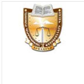
29.10.2014 ՀԱՅՏԱՐԱՐՈՒԹՅՈՒՆ «ԺԱՄԱՆԱԿԱՎՈՐ ԱՆԱՇԽԱՏՈՒՆԱԿՈՒԹՅԱՆ ՆՊԱՍՏՆԵՐԻ ՄԱՍԻՆ» ՀՀ ՕՐԵՆՔՈՒՄ ԼՐԱՑՈՒՄՆԵՐ ԵՎ ՓՈՓՈԽՈՒԹՅՈՒՆՆԵՐ ԿԱՏԱՐԵԼՈՒ ՄԱՍԻՆ» ՀՀ ՕՐԵՆՔԻ ՆԱԽԱԳԾԻ ՎԵՐԱԲԵՐՅԱԼ