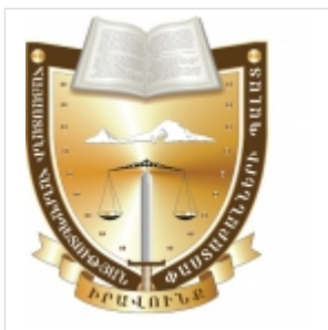
29.10.2013 ԱՎՈՒՄԲԻ ՆԻՍԻ ՀՐԱՎԵՐ