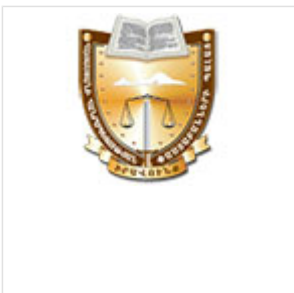
17.09.2013 ՍԵՊՏԵՄԲԵՐ ԱՄՍՎԱ ՎԵՐԱՊԱՏՐԱՍՄԱՆ ԴԱՍԸՆԹԱՑՆԵՐ