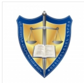
30.09.2013 «ՍՏՐԱՏԵԳԻԱՅԻ ԱՐՎԵՍԸ» ԹԵՄԱՅՈՎ ԴԱՍԱԽՈՍՈՒԹՅՈՒՆ