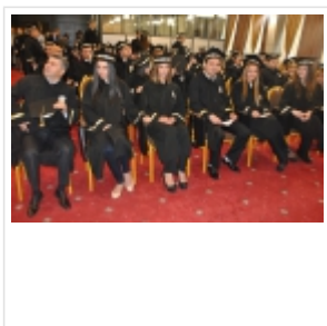
06.10.2013 ՓԱՍՏԱԲԱՆԱԿԱՆ ՀԱՄԱՅՆՔԸ ՀԱՄԱԼՐՎԵՑ ՆՈՐ ՓԱՍՏԱԲԱՆՆԵՐՈՎ